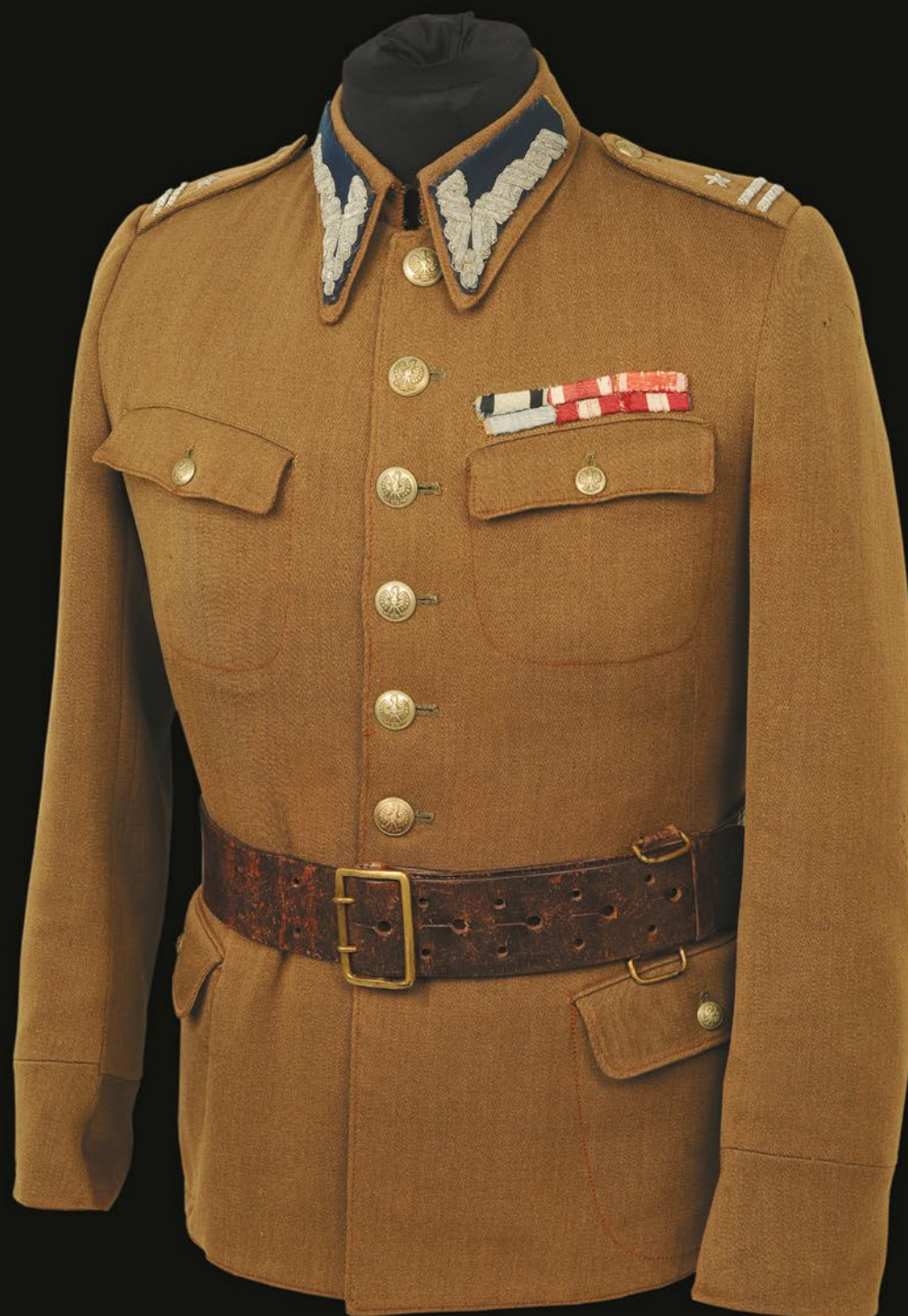
➤ KURTKA MUNDUROWA MAJORA HENRYKA SUCHARSKIEGO ZE ZBIORÓW MUZEUM GDAŃSKA