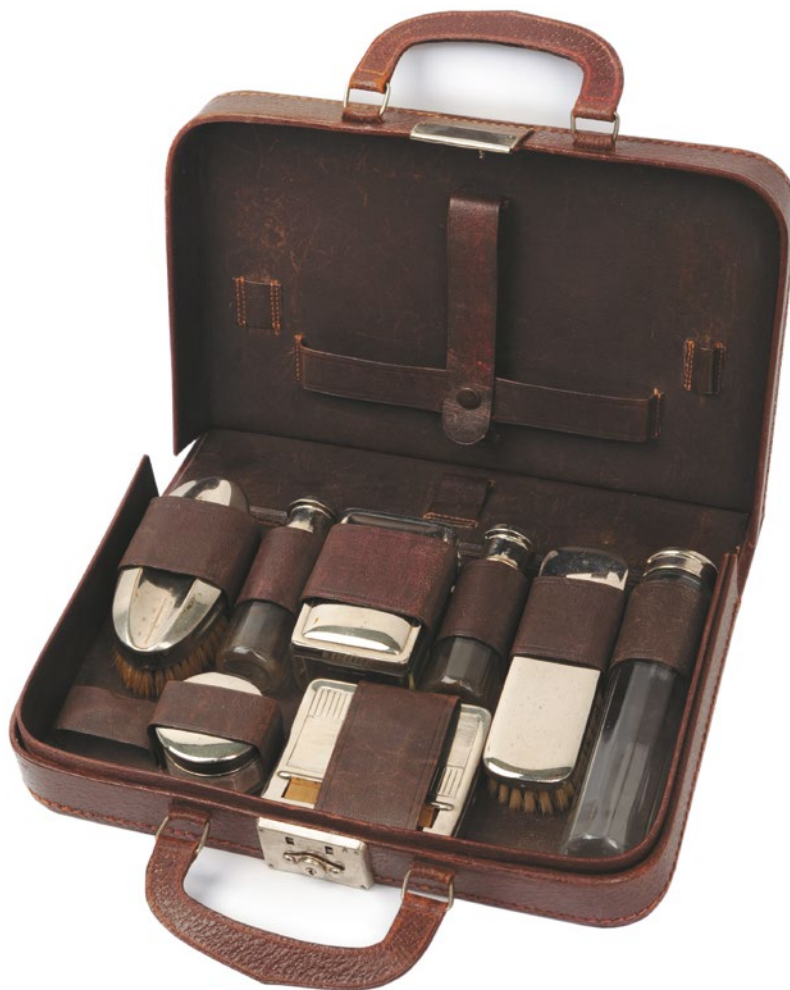
→ NESESER TOALETOWY MAJORA HENRYKA SUCHARSKIEGO ZE ZBIORÓW MUZEUM GDAŃSKA

Poszczególne oddziały gromadzą obiekty związane z profilem swojej działalności, stosując specyficzne dla każdego z oddziałów kryteria doboru.