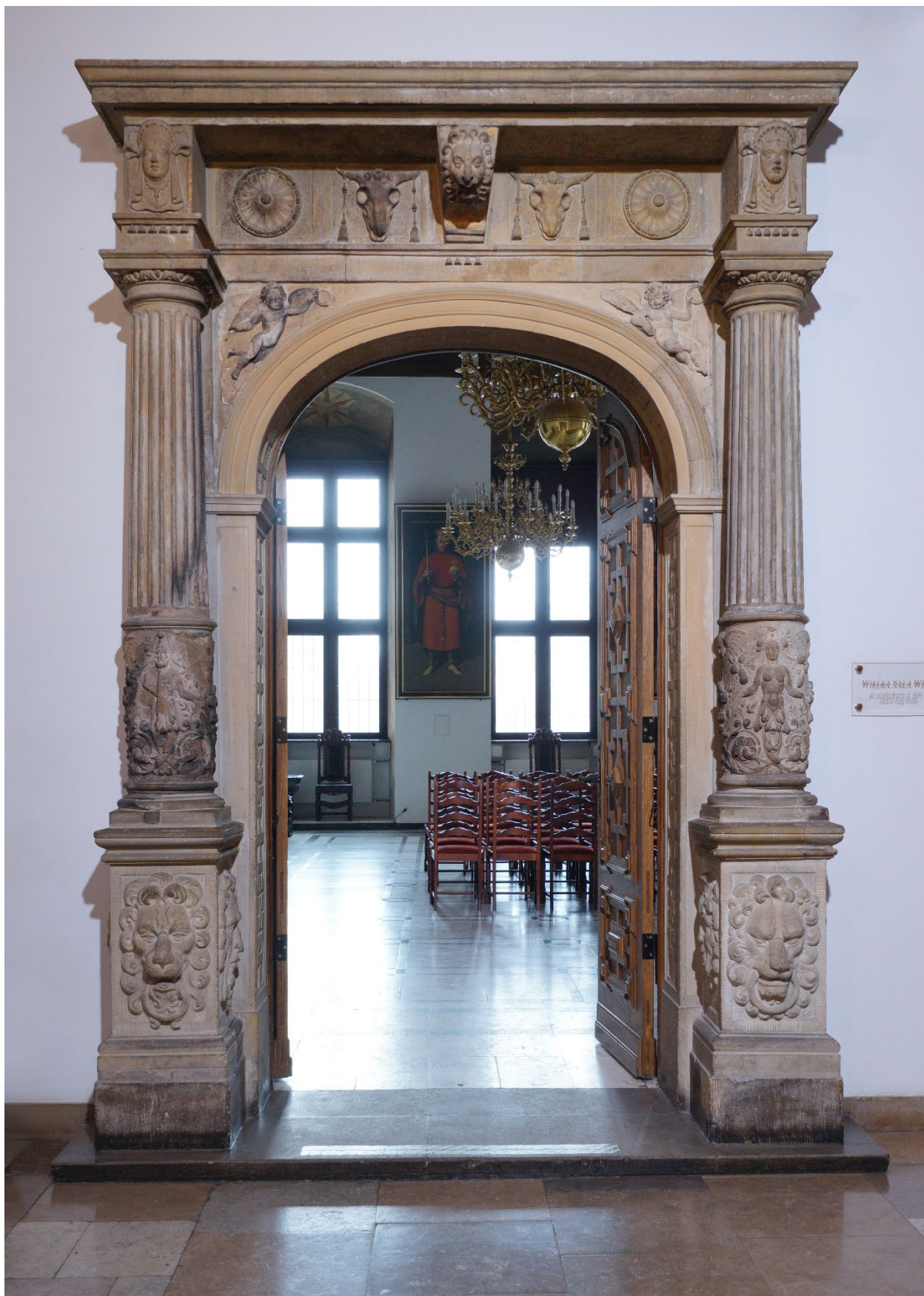
Вхід до Великого Залу Вети (пол. weta) у Ратуші Головного міста.