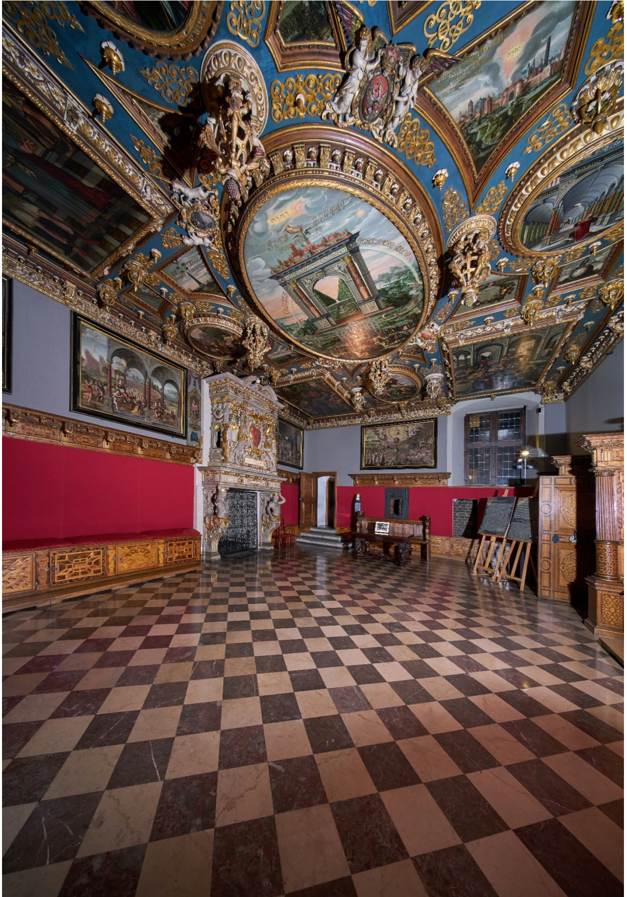
Червоний зал у Ратуші Головного міста.