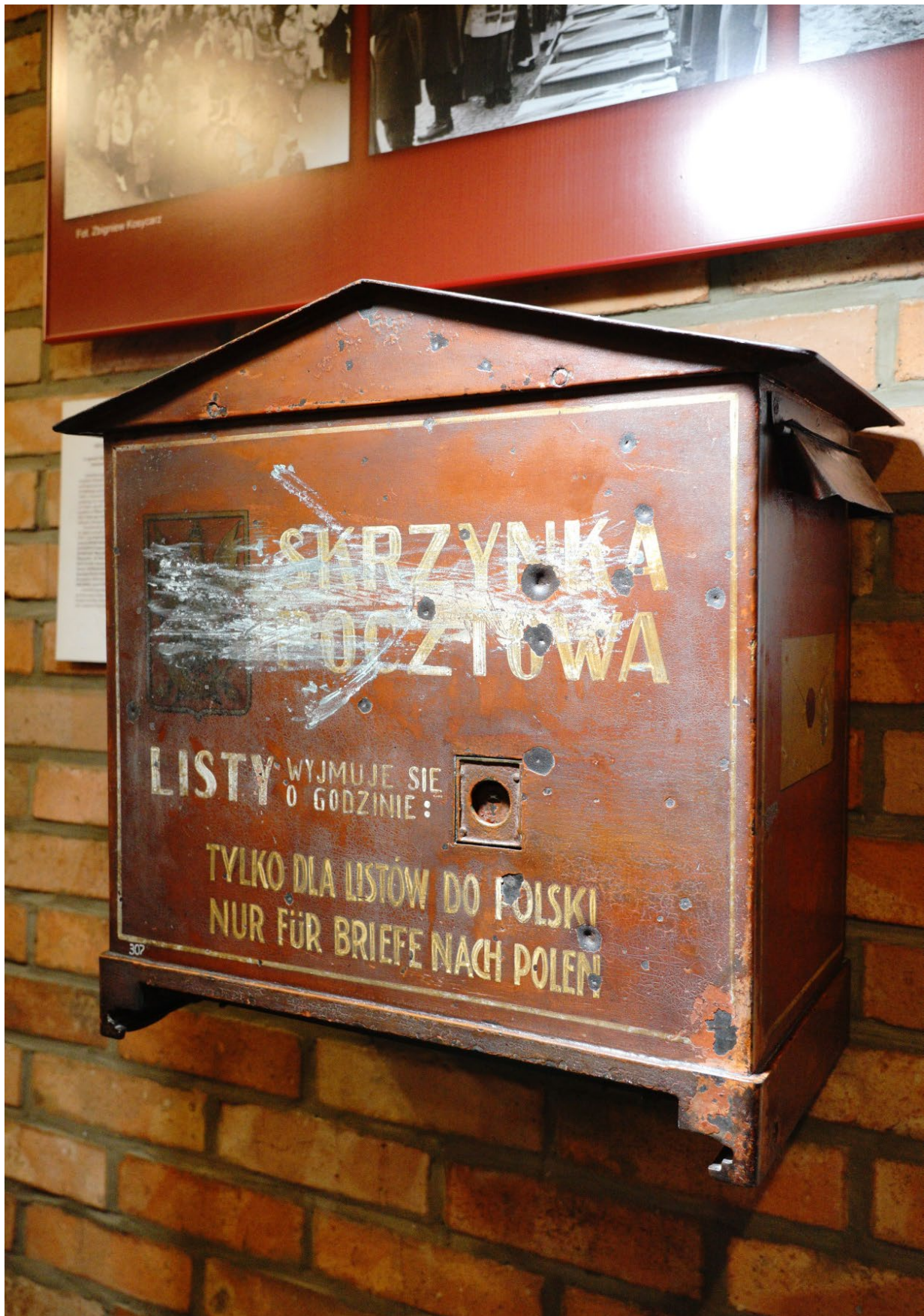
Polska skrzynka pocztowa z Wolnego Miasta Gdańska.