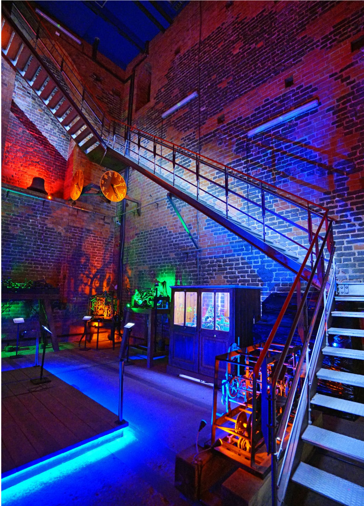
Sala wystawowa na poziomie 2.