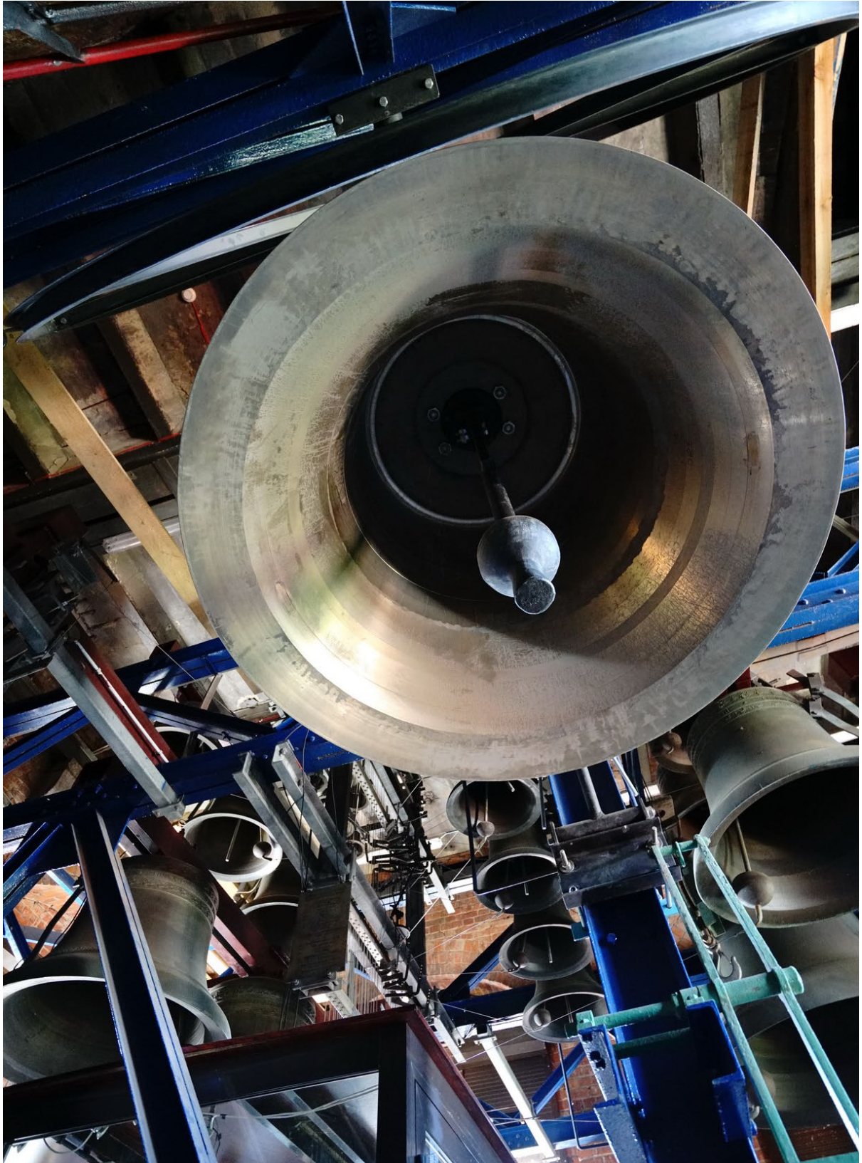
Dzwony carillonu w wieży kościoła św. Katarzyny.