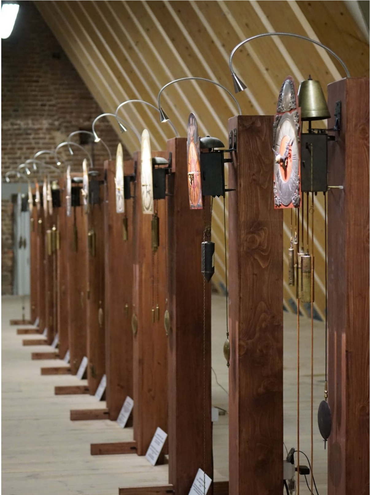
Wystawa zegarów żuławskich na poddaszu.