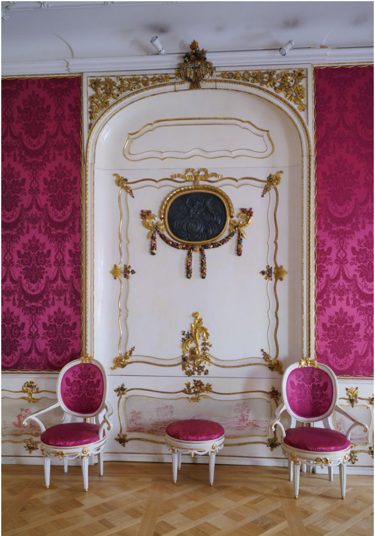
Salon Domu Uphagena.