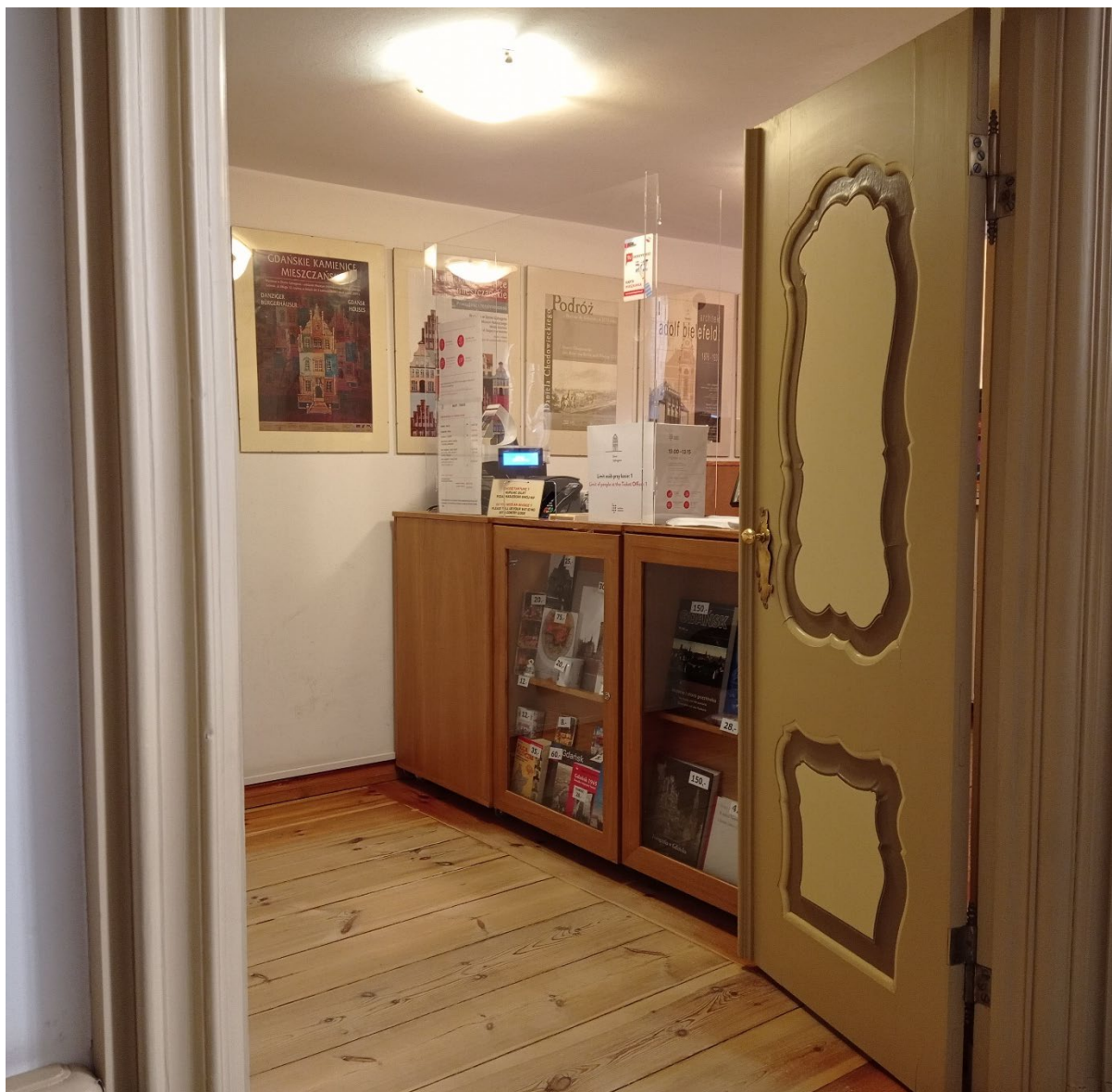
Kasa w Domu Uphagena. Tu kupisz bilety i pamiątki.