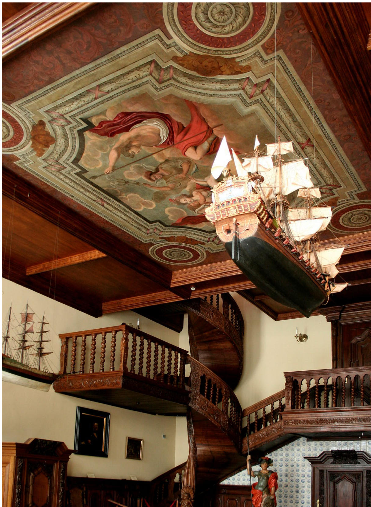
Sień Gdańska w Dworze Artusa.