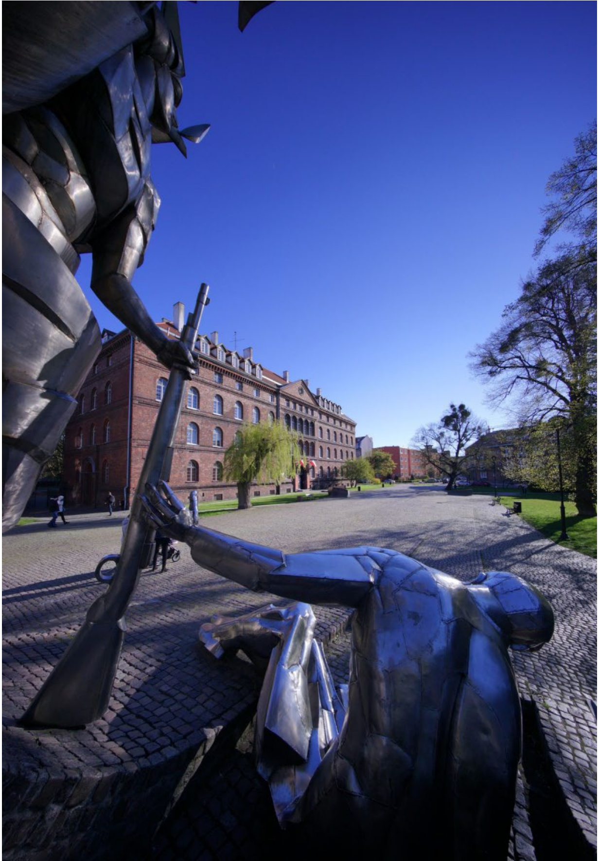
Пам'ятник Захисникам Польської Пошти.