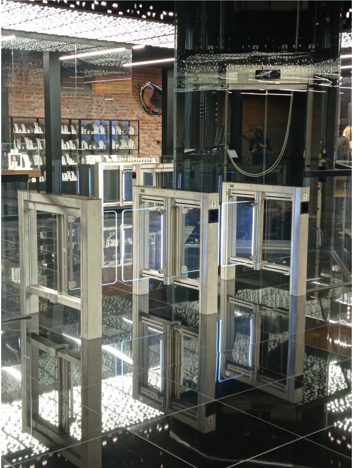
Турнікети, через які потрібно пройти.