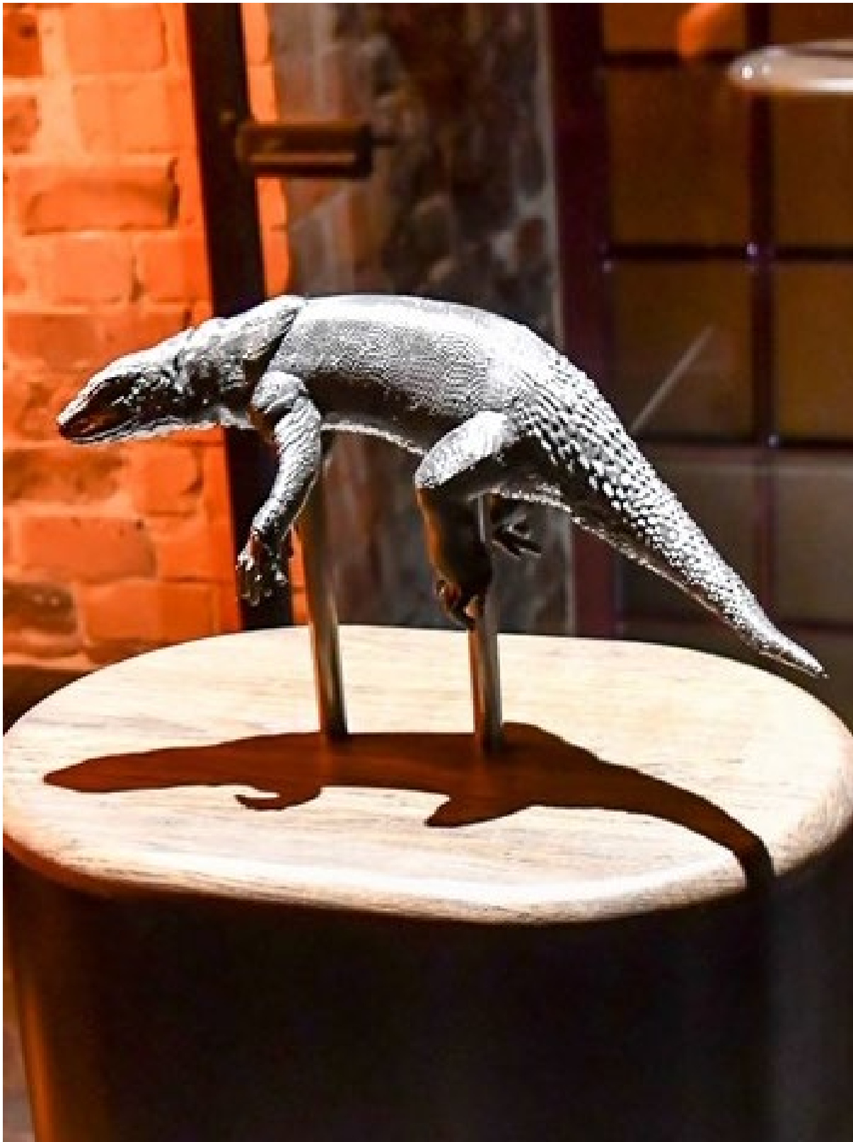
Макет ящірки, до якого можна доторкнутися.