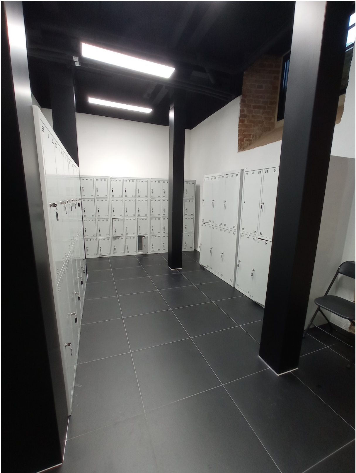
Роздягальня в Музеї Бурштину.