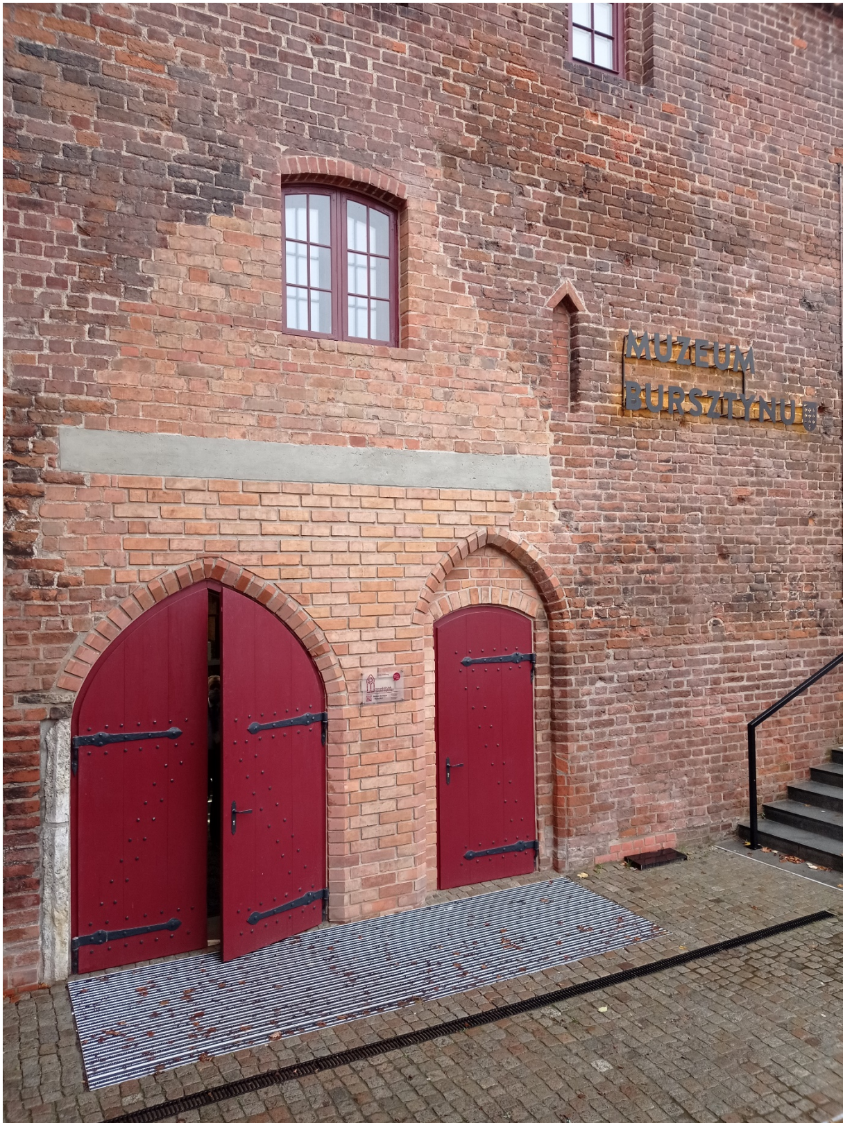
Головний вхід до Музею Бурштин.