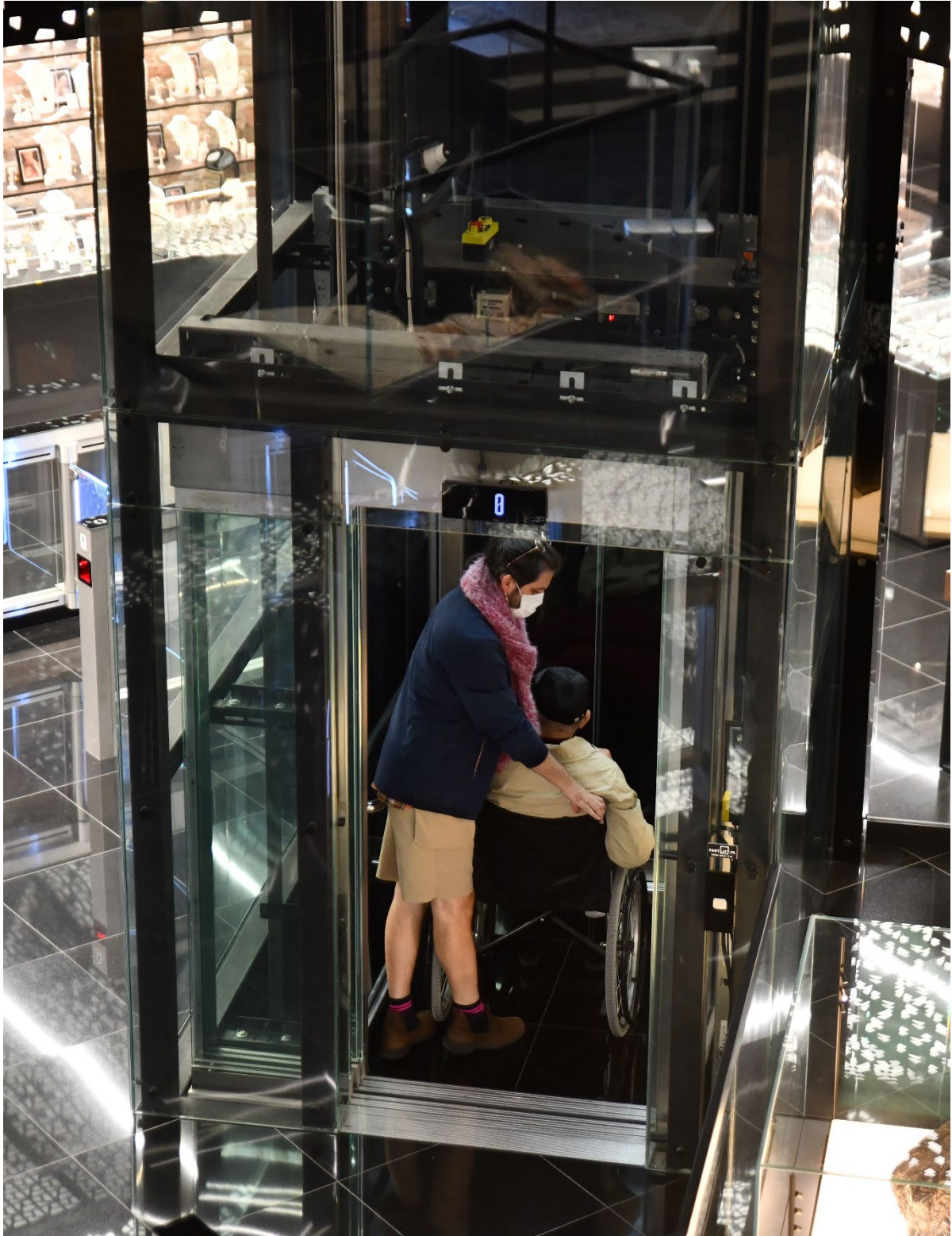
Ліфт у Музеї Бурштину довозить на всі поверхи.