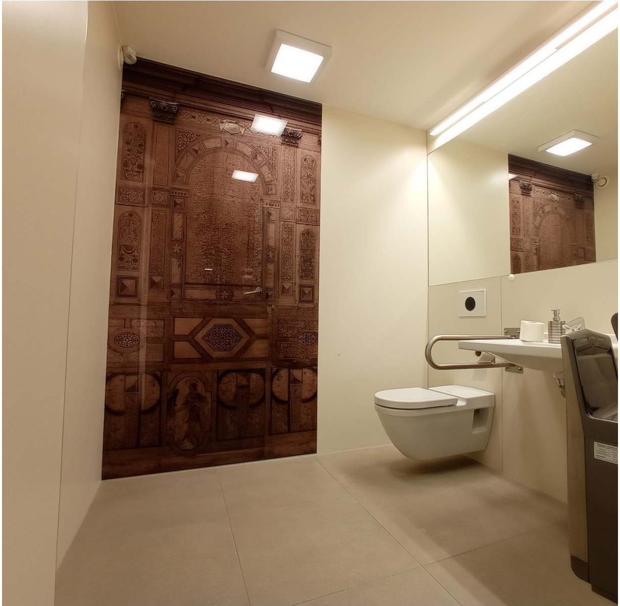
Туалет для людей з інвалідністю. Він розташований біля гардеробної.