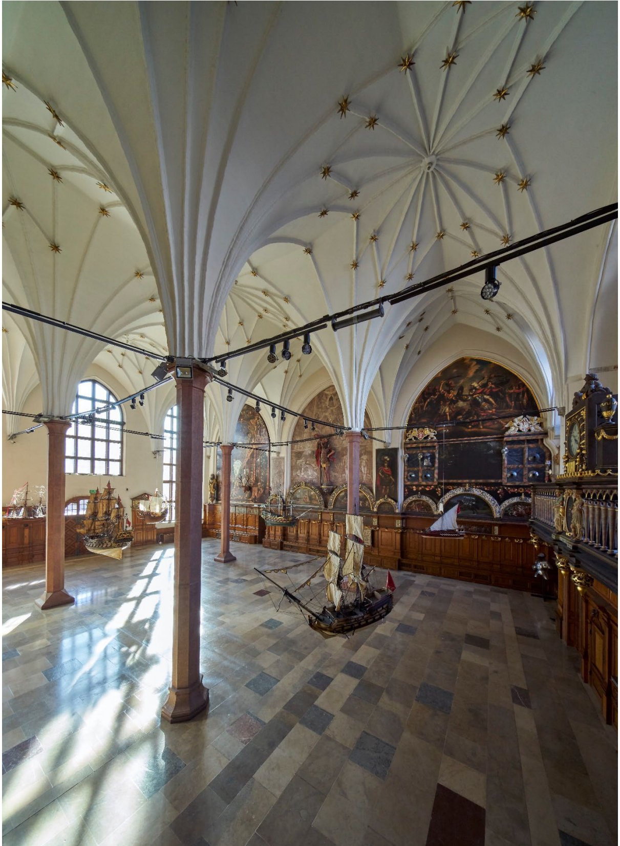
Великий Зал Двору Артуса.