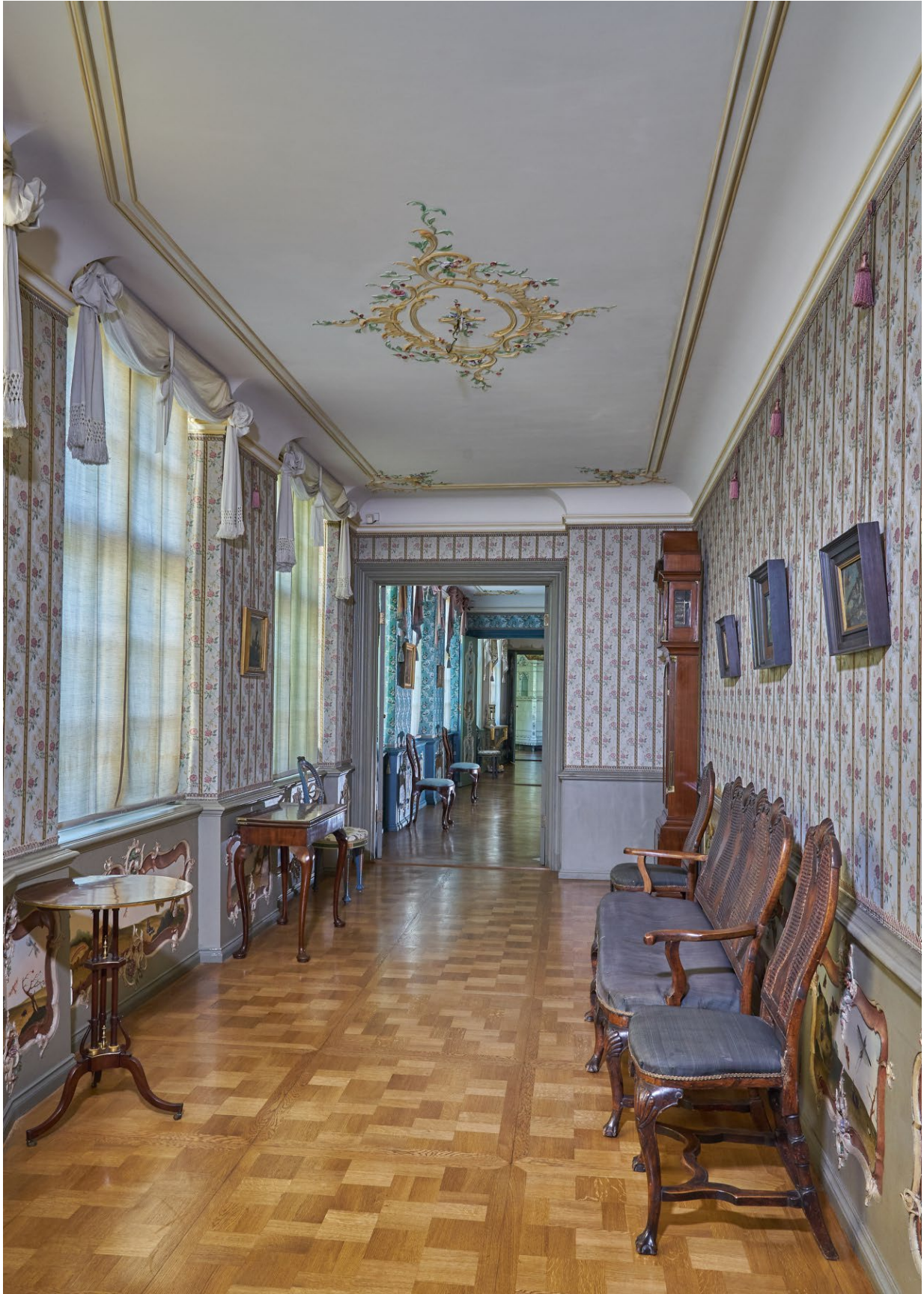
Кімната комах. На задньому плані видніється Кімната квітів.